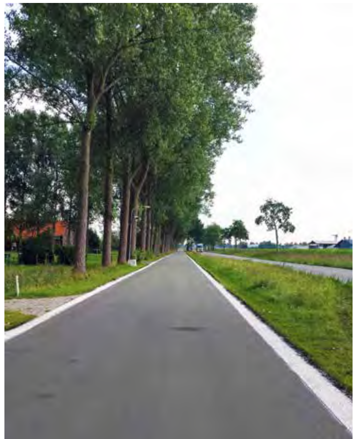
In Groningen en Friesland onderzoeken men het effect van bermstroken van reflecterende steenslag (Luxovit).

De resultaten van het project bevestigen een aantal richtlijnen van het CROW. Zo blijkt dat voldoende breedte van het fietspad ten opzichte van de fietsintensiteiten van groot belang is voor de positie die fietsers innemen. Een fietspad