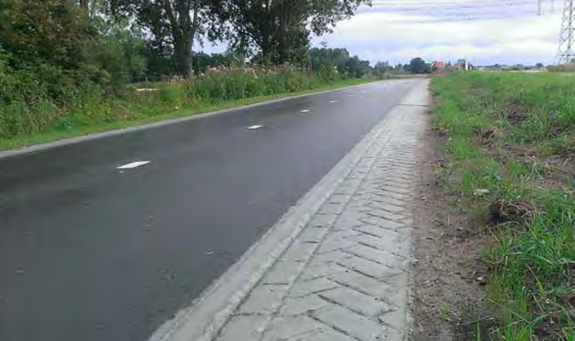
Een betonnen bermverharding (met streetprint) werkte op de proeflocatie het beste. Het biedt de fietser de mogelijkheid te corrigeren als hij in de berm belandt.

groeïend gras en modder. Een betonnen fietspad, dat goed contrasteert met de berm, heeft hetzelfde effect als een fietspad met kantmarkering. Geënquêteerde fietsers bleken een uitgesproken voorkeur te hebben voor kantmarkering.